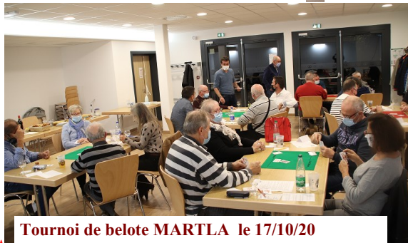
Tournoi de belote MARTLA le 17/10/20