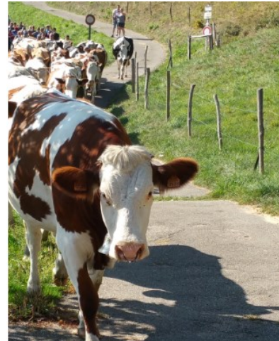
Transhumance Versant du soleil Le 20/09/20