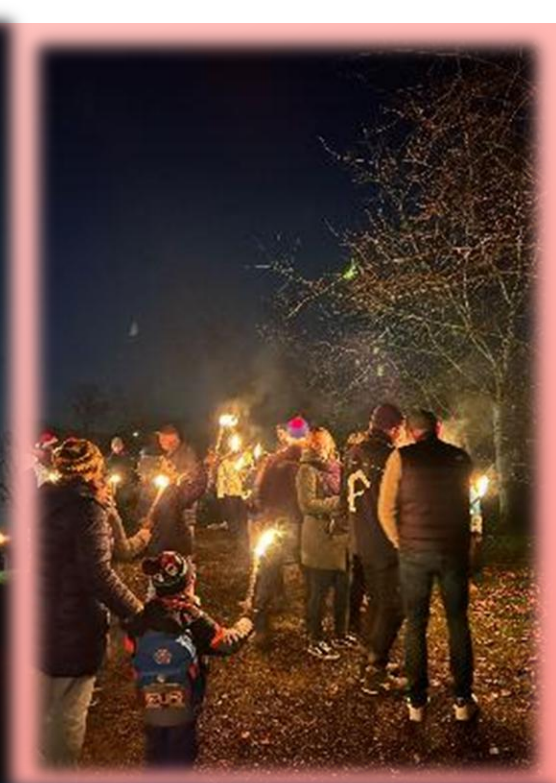
La descente aux flambeaux depuis le Bergbrochen